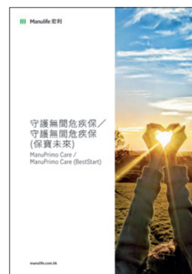
▲「守護無間危疾保」提供周全保障及靈活選項。