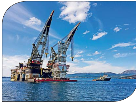
挪威是西歐最大產油國，已獲邀請參加周四的OPEC+會議。圖為挪威一處油井。

挪威石油部周一(6日)表示，已獲邀請參加周四的OPEC+會議，如果減產協議得到產油