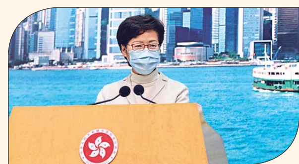
特首林鄭月娥昨日表示，民眾希望第二輪防疫抗疫基金能夠更有效地做到「保就業」，特別是保護基層員工的就業。

由於香港疫情仍算嚴重，因此目前限制社交距離的一系列防疫措施，以及關閉戲院等場所的安