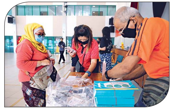
新加坡除先後推出3輪紓困措施外，近日亦向民眾派發免費可重用的口罩。

全球多國亦因疫情推出紓困措施，例如英國。財相辛偉誠(Rishi Sunak)早前指，關閉全英國的酒吧等餐飲娛樂場所措施會對業界造成巨大影響，為免員工被解僱，政府決定負擔員工80%薪金，上限每月2,500英鎊（約22,675港元），亦會補貼自僱人士每月收入80%，以過去3年每月平均利潤計算。