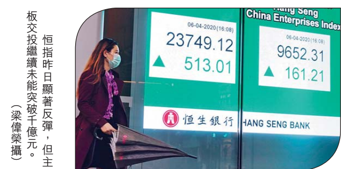
板交投繼續未能突破千億元，但主