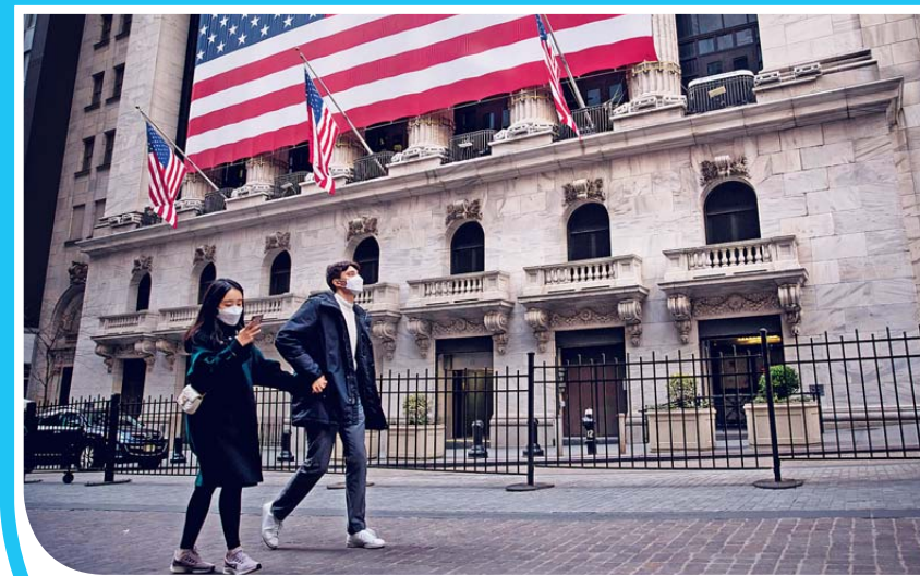
美國疫情似有放緩迹象，道指周一向上，部分避險資金離開美債，美債價跌息升。

俄羅斯近期爭取美國加入減產行列，美國總統特朗普(Donald Trump)上周五跟美國各大油企高層會晤，外界揣測特朗普是否要求各企業配合減產。