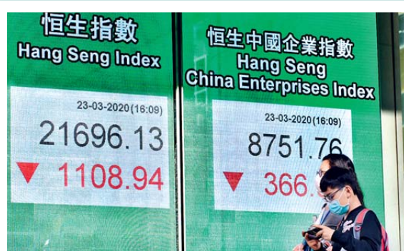
亞洲股市昨天普遍走低，恒指亦瀉逾1100點，50隻藍籌「全軍覆沒」。