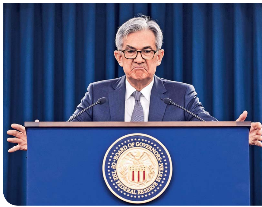
聯儲局在主席鮑威爾的帶領下，近期連環出招救市，昨更推出無上限量寬措施，令市場意外。